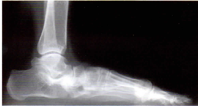
X線像でアーチが消失している

足が扁平化し、かかとが外を向くようになると後ろから複数の足指が見えるようになります。重症度は体重をかけたときの足のX線像で評価します。腱の損傷はX線像には写りませんので、MRI検査を行います。MRIは磁気で行う検査で非侵襲的です。