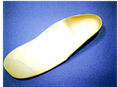
アーチサポート付きの足底板