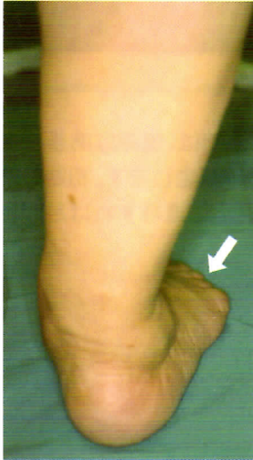
後ろから複数の足指がみえる

足が扁平化し、かかとが外を向くようになると後ろから複数の足指が見えるようになります。重症度は体重をかけたときの足のX線像で評価します。腱の損傷はX線像には写りませんので、MRI検査を行います。MRIは磁気で行う検査で非侵襲的です。