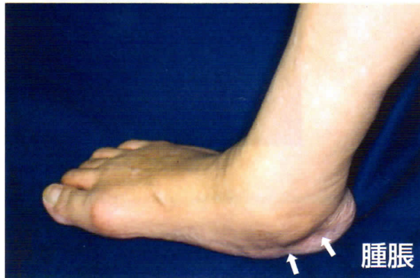
後脛骨筋腱に沿っての腫脹

幼児の頃から足裏が平べったく、大人になってもそのまま残っているタイプの扁平足では、痛みはあまりありません。これに対して中年以降に発症する扁平足では内側のくるぶしの下が腫れ、痛みが生じます。初期には足の扁平化は目立ちませんが、しだいに変形が進みます。つま先立ちがしにくくなり、さらに進行すれば足が硬くなって歩行が障害されます。