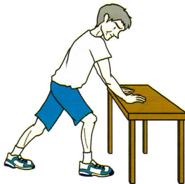
アキレス腱のストレッチング