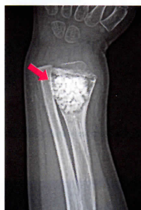
搔爬+人工骨充填後